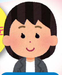
社会福祉士 しゃかいふくし