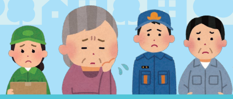
地域の人・身近な大人 ちいき ひと みちか おとな