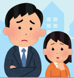
学校の先生・福祉の人 がっこう せんせい ふくし ひと