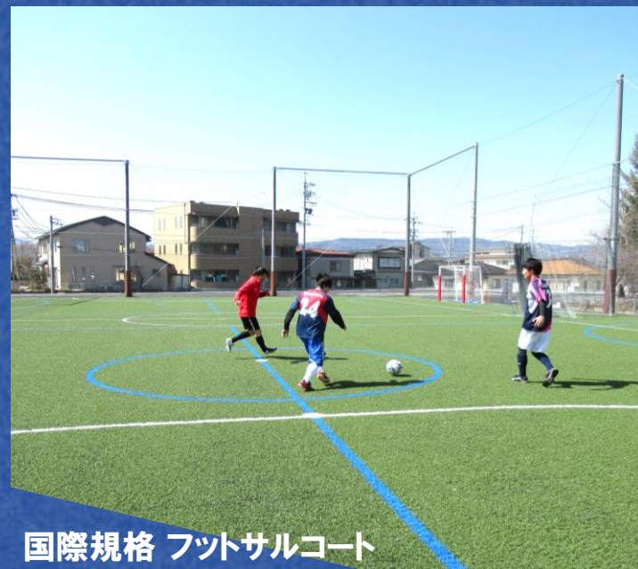
国際規格 フットサルコート