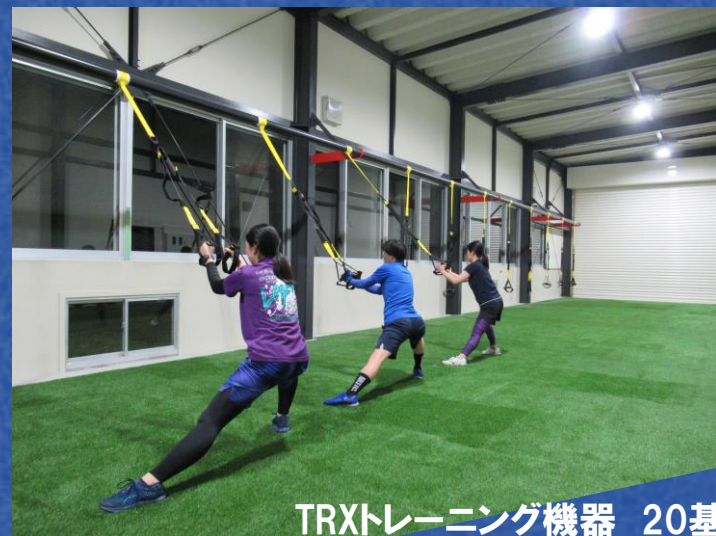
TRXトレーニング機器 20基

4つの基本的な動作をもとにバランス感覚、空間把握、身体コントロールなどの発達を促します。子どもから大人まで楽しめる、下諏訪オリジナルのパルクールエリア。